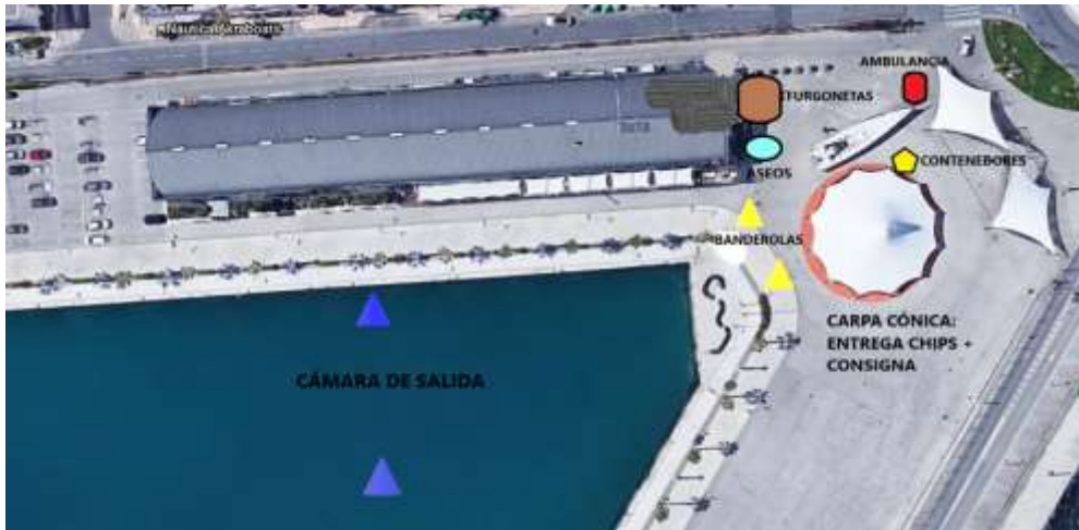
Plano del recorrido travesía clásica 4000 metros (14 años en adelante)