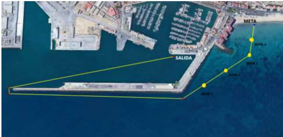
Plano del recorrido travesía infantil 300 metros (8 a 13 años)